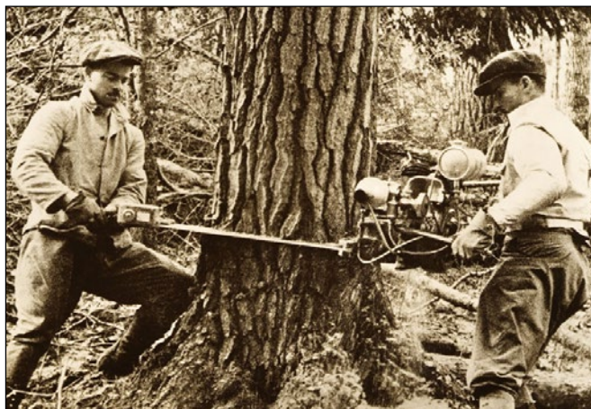
Prvá benzínová motorová píla na svete (Dolmar, 1927)

Od 1. 1. 2014 platí nový zákon č. 506/2013, ktorým sa mení a dopĺňa zákon č. 543/2002 Z. z. o ochrane prírody a krajiny v znení neskorších predpisov, a ktorým sa menia a dopĺňajú niektoré zákony, ktorý v § 47 ods. 4 ustanovuje, na ktoré dreviny je potrebný súhlas na výrub od orgánu štátnej správy na úseku ochrany prírody a krajiny, a na ktoré dreviny sa nevyžaduje súhlas. Nakoľko obec vykonáva podľa § 69 zákona o ochrane prírody a krajiny v prvom stupni štátnu správu vo veciach ochrany drevín v rozsahu ustanoveným týmto zákonom, podľa § 47 ods.3 zákona o ochrane prírody a krajiny dáva súhlas na výrub drevín. Tento súhlas sa môže vydať len po posúdení ekologických a estetických funkcií dreviny a vplyvom na zdravie človeka, so súhlasom vlastníka alebo správcu, prípadne nájomcu, ak mu takéto oprávnenie vyplýva z nájomnej zmluvy, pozemku na ktorom drevina rastie, ak žiadateľom nie je jeho vlastník, správca alebo nájomca a po vyznačení výrubu dreviny.