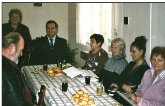
Starosta a členky ZPOZ-u v klube dôchodcov

Už 37 rokov uplynulo od založenia klubu dôchodcov a musím spome-