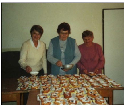
Fašiangové stretnutie pri šiškách

Stretávame sa často pri rôznych príležitostiach aj so starostom obce, s poslancami, prídu nás navštíviť aj naši sponzori, ktorí nám vždy niečím prispievajú k pohosteniu. V klube máme posedenia s členkami ZPOZ-u. Tieto speváčky možno prirovnať k prameňu čistej vody pre smädného, ktorý si chce uhasiť smäd a ovlažiť pery, veď vo svojom nevy-