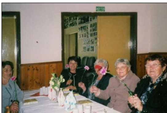
Deň matiek a výročná členská schôdza 12.5.2013

sme boli, ale starými všetci raz budeme a práve pre týchto ľudí je potrebné vybudovať priestory, aby sa mohli schádzať a spoločne prežívať roky pokojnej jesene života.